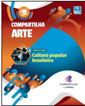
COMPARTILHA ARTE – CULTURA POPULAR BRASILEIRA Editora: Moderna