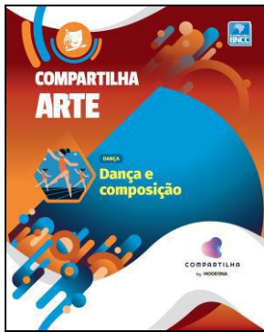
COMPARTILHA ARTE – DANÇA E COMPOSIÇÃO Editora: Moderna