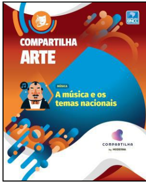
COMPARTILHA ARTE – A MÚSICA E OS TEMAS NACIONAIS Editora: Moderna