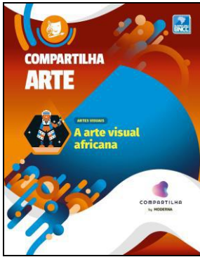
COMPARTILHA ARTE – A ARTE VISUAL AFRICANA Editora: Moderna

Bloco Canson A4 desenho 140g/m 2 ; Lápis de cor; Canetas hidrocor; Régua 30 cm; Lápis preto 6B/2B; Borracha; Pasta com plástico transparente. Obs.: O bloco Canson deverá ser repostado, caso seja necessário, ao longo do ano letivo.