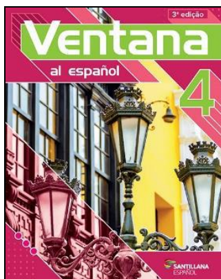
VENTANA AL ESPAÑOL – 4 Editora: Santillana Español Autores: Santillana Español ISBN: 9786557797853